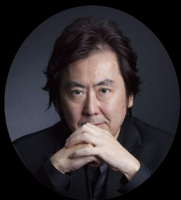
猿谷紀郎 SARUYA Toshiro

奈良系の楽家に生まれ、宮内庁楽部楽師を経て、フリーでの演奏や作曲活動を行う。1985年伶楽舎を結成し長らく音楽監督を務めた。雅楽の演奏では特に横笛の名手として知られ、作曲では現代雅楽、現代邦楽の作曲、雅楽廃絶曲の復曲、正倉院復元楽器のための復曲作品も多く手掛ける。特に古典様式による雅楽作品の作曲については並ぶ者がなく、優れた作品を多く残している。2003年より日本藝術院会員。2011年文化功労者。2017年文化勲章受章、その他受賞多数。1935年生まれ、2019年永眠。