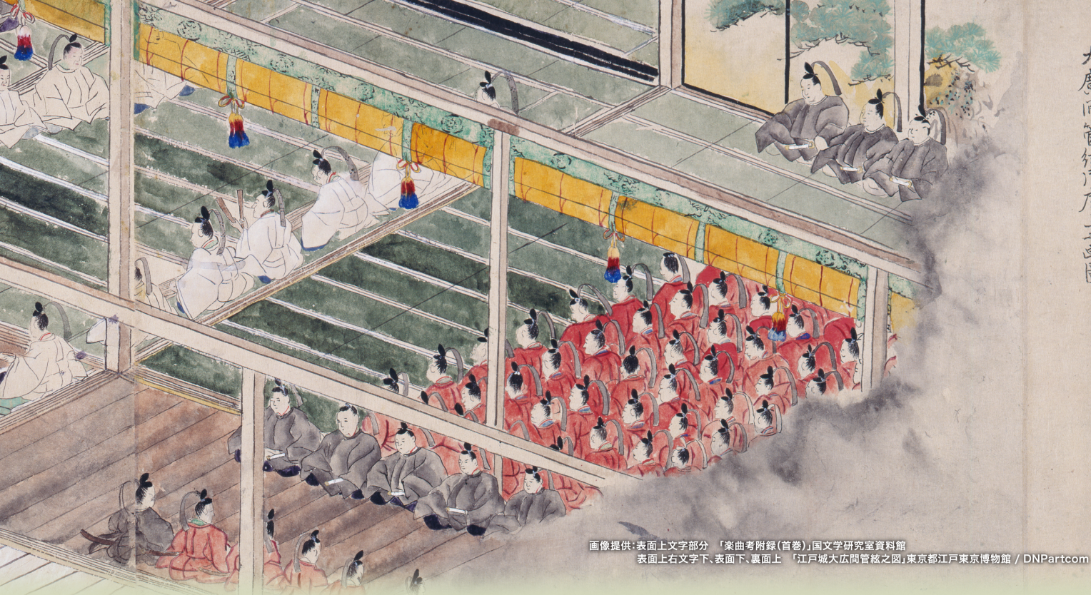
画像提供: 表面上文字部分 「楽曲考附録(首巻)」国文学研究室資料館 表面上右文字下、表面下、裏面上 「江戸城大広間管絃之図」東京都江戸東京博物館 / DNPpart.com

雅楽といえば平安貴族の姿が思い浮かびますが、雅楽が復興・隆盛した時代として江戸時代を忘れることはできません。三代将軍家光は二条城で舞楽「青海波」を約200年ぶりに復興させましたし、八代将軍吉宗の二男、田安宗武は雅楽研究に没頭して復曲を試み、膨大な楽譜を残しました。儒学者からも雅楽に関心を持ち、荻生徂徠は裏紙に書かれた「秋風楽」の笛譜と歌詞を発見して、琵琶をつけて歌ってみたいしています。