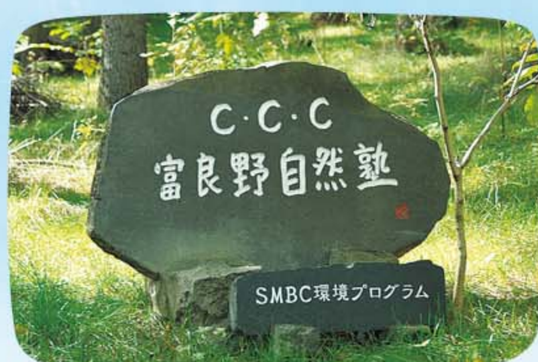
富良野自然塾への協賛