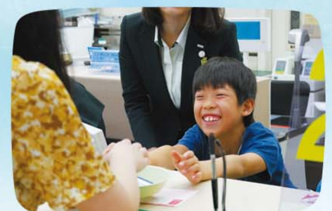
仕事に触れて銀行を学ぶ 銀行たんけん隊