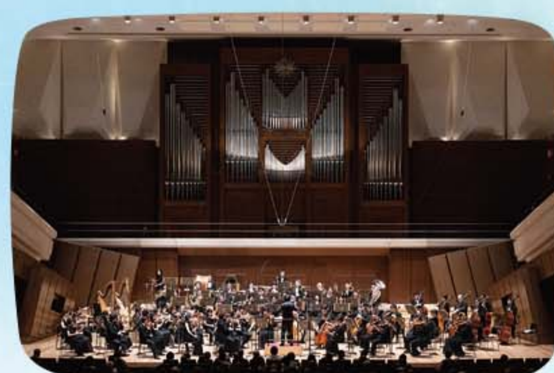
感染症対策としての文化芸術支援